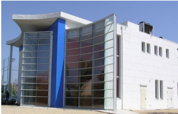
Salle de la maison des sports...