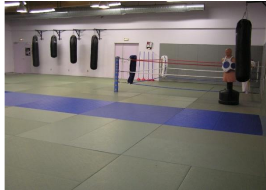
Vo Duong pour le stage