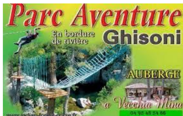
Parc aventure de Ghisoni

Tps libre = Temps libre (avec une demi journée sur Ajaccio ou Bastia).